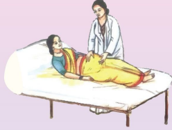
প্রসবের সময় প্রশিক্ষণপ্রাপ্ত সেবাদানকারীর সাহায্য নিন