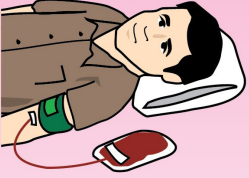
সঠিক ও নিরাপদ রক্তদাতার ব্যবস্থা রাখুন