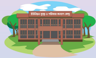
সপ্তাহের প্রতিদিন ২৪ ঘণ্টা স্বাভাবিক প্রসব সেবা দেয়া হয় এমন কেন্দ্রে (এফডব্লিউসি) নিয়ে যান