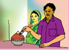
প্রসবের জন্য আগে থেকেই সঞ্চয় করুন