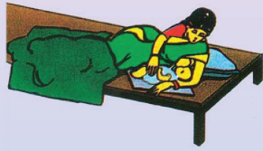
জন্মের সাথে সাথেই শিশুকে শাল দুধ দিন, ৬ মাস পর্যন্ত শিশুকে শুধুমাত্র মায়ের দুধ খাওয়ান এবং শিশুকে টিকা দিন