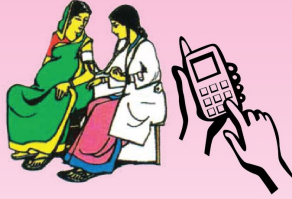
কাছের সেবাদানকারীর সাথে যোগাযোগ এবং ফোন নম্বর সংগ্রহে রাখুন